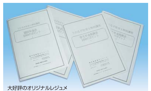
大好評のオリジナルレジュメ